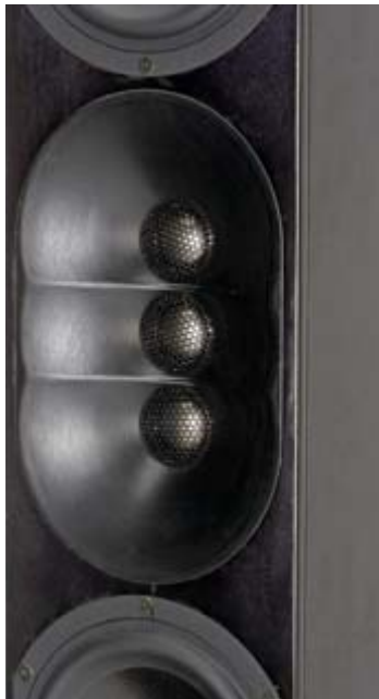
AURELIA Graphican kolmella titanium-kalottidiskantilla ja suuntaimella toteutettu korkeaäänielementti on lajissaan parasta, mitä olemme kuulleet.

Bassopää on aika optimaalinen soinniltaan, eikä missään tule tun-